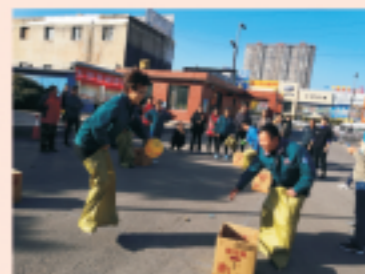
太原豪峰职工趣味运动会袋鼠运瓜比赛

2018年10月25日，太原豪峰污水处理有限公司举办“凝心、聚力、创佳绩”职工趣味运动会，来自公司各部门的6个代表队，40余人参加。本着团结协作、弘扬传统文化的原则，运动会设同舟共济、袋鼠运瓜、齐心协力、勇往直前、师徒上阵、跳绳、毽子和呼啦圈等团体或个人比赛，旨在进一步丰富职工的业余文化生活，提高职工队伍的凝聚力。