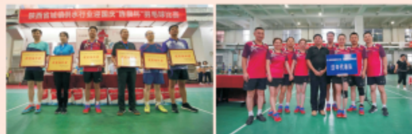
汉中水司健将“旌旗杯”羽毛球比赛

2018年9月13日至14日，在陕西省供水排水协会举办的首届陕西省供水行业职工羽毛球“旌旗杯”比赛中，汉中市国中自来水有限公司选派的羽毛球健将们发扬团结、顽强、拼搏精神，取得了男子双打第三名、女子双打第四名、混双第四名以及团体优秀组织奖，展现了汉中水司供水人良好的精神风貌和团队精神。