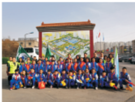
太原豪峰接待小学师生参观