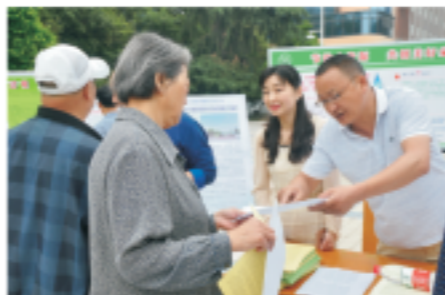
汉中水司向市民提供专题咨询服务

2018年8月12日，为了让市民近距离地接触自来水加工过程，了解了自来水的生产工艺和水质要求，提高节水、保水意识，湘潭国中水务有限公司邀请了湘潭环保协会的志愿者和湘潭一中学生参观自来水厂。活动结束后，志愿者和学生们纷纷表示感受到水的来之不易，在以后的生活中会从自身做起，更加珍惜水资源，做节水、护水的好公民！