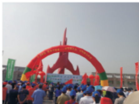
秦皇岛市六五环境日活动现场

2018年6·5世界环境日，北京中科国益环保工程有限公司员工来到南锣鼓巷，组织开展了“美丽中国，我是行动者”宣传环保公益活动，结合公司环保工作重点与公众关注的环境问题，用行动践行我们的宣言与奉献！