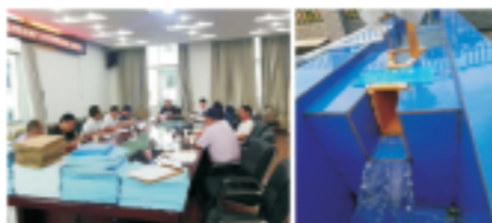
竣工验收总结会 计量槽出水效果一隅

2018年7月，荣县度佳镇等12个乡镇生活污水厂BOT项目竣工验收，验收组现场查验了厂区建设、进场道路、场外机电、场外接水、管网、处理效果等内容，并对我司的工艺和调试效果给予了充分肯定。该项目于2015年开始建设，在国中各级员工的不懈努力下，项目得到了地方党政机关和相关职能部门的大力支持，2018年5月，12乡镇13个厂站全部实现达标排放，成为国中水务响应国家建设美丽乡村的又一标杆。