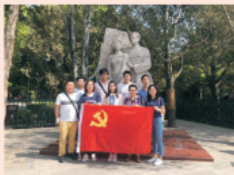
中科国益党员在高君宇、石评梅二人的雕像前合影

2018年5月4日“五四青年节”，北京中科国益环保工程有限公司党支部与团支部成员前往北京陶然亭公园开展“缅怀革命志士，践行五四精神”活动。传承“五四精神”，用新时代中国特色社会主义思想武装自己，牢固树立“四个意识”、坚定“四个自信”，在“贯彻学习十九大精神的基础上，永葆革命的精神和斗志，为实现中国梦而努力奋斗！