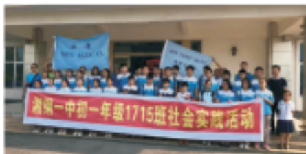
湘潭水务接待师生和环保协会环保志愿者参观

2018年7月25日，西宁市虎台中学初中一年级学生及家长在老师的带领下来到青海雄越环保科技有限责任公司参观、学习。活动旨在教育学生们保护环境从小做起、从自身做起，让保护水资源理念植根于广大青少年心中。