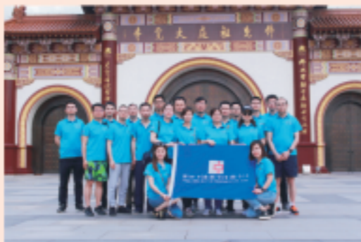
国中上海重智尚真凝力共进主题团建

2018年6月2日，国中（上海）环保科技有限公司赴江苏宜兴大觉寺及周边开展团队建设活动，围绕“重智尚真 凝力共进”主题，开展了佛教经典学习，并组织了各类趣味团队竞技活动。让员工在活动中逐渐参悟人生的正念、正见、正思维，激发基层员工的艰苦奋斗精神，鼓励中高层员工发现并修补在企业经营中存在的错误与缺陷，激励全体员工借助自己的智慧不断探求和接近各自工作领域的真理，加强团队沟通与协作能力，共同成就卓越人生、卓越企业。