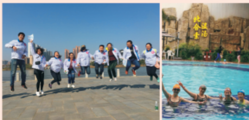
三八妇女节系列活动

湘潭国中水务有限公司参与了湘潭经开区庆三八“巾帼心向党，奔向新时代”九华湖大型定向越野徒步暨全民健身活动，以团队趣味积分定向赛的形式为契机，推广全民健身活动，号召员工不断增强体质、磨炼意志，以崭新的精神风貌和团队拼搏精神，积极投身建设美丽中国的新时代。