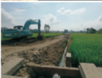
开拓新水源 保障夏季供水高峰

2018年4月20日，汉中市中心城区临时应急供水水源井建设项目（第一批）完成全部设备调试，正式并网运行。该项目于2017年10月开始筹建，主要解决汉中市中心城区2018年夏季供水高峰期缺水的问题。全部4口应急水源井的投入运行，可日增供水量1.5万立方米，基本满足汉中市中心城区2018年夏季高峰期供水需求。