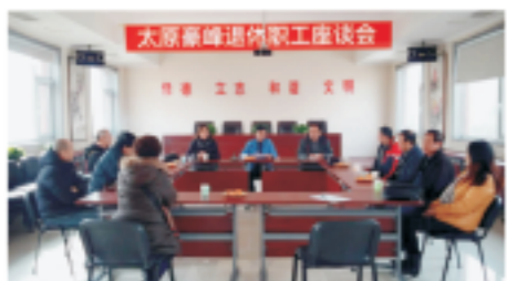
同谋发展 共叙友情 退休职工座谈会

国水（昌黎）污水处理有限公司一员工及其母亲分别于2018年5月和1月确诊肺癌，均接受了手术和化疗，病痛折磨着母女二人，巨额医疗费已将这个普通家庭掏空，肉体、精神和生活的压力几近压垮瘦弱的她。一方有难，八方支援，总公司得知该消息后立即号召全体员工伸出援手，献上一份爱心。虽然大部分人与她素不相识，但大家纷纷慷慨解囊，短短4天时间里累计收到善款近10万元，让身处病痛危难中的同胞看到一线生活的希望和信心，不仅体现了国中人的奉献精神，更是给予了母女俩战胜病魔的决心和信心。