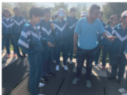
青海雄越接待初中师生参观

2018年4月26日，来自太原团市委、太原市环保局、ofo太原公司、中信银行太原分公司等80余名青年环保志愿者，身着统一的蓝色环保志愿者马甲，骑着ofo黄色共享单车来到太原豪峰污水处理有限公司，进行了以“探寻污水净化之旅，提高市民节水意识”为主题的百位市民看环保参观活动。