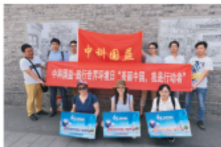
中科国益践行世界环境日公益活动

2018年5月18日，在第27个全国城市节约用水宣传周之际，汉中市国中自来水有限公司组织公司水质管理部、行政管理部、客户服务部等相关部门，在汉中市街心花园开展了供水节水宣传活动，向市民提供水质卫生知识、节水知识、节水器材、水质检测等专题咨询服务。合计发放宣传资料千余份，接待咨询服务八百多人次。在向广大市民宣传了城市供水节水的重要意义的同时，塑造了汉中水司良好的社会形象。