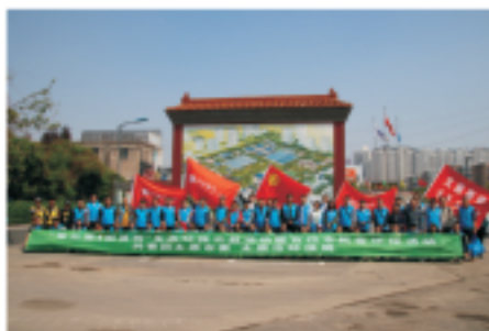
太原豪峰接待团市委和市民志愿者参观

为了纪念第三十一届中国水周，2018年3月28日，太原市晋源区五府营中心小学组织4~6年级40余名学生来到太原豪峰污水处理有限公司，参观污水处理工艺全过程。此次参观是太原豪峰近年来接待未成年人参观人数最多、规模最大的一次，不仅让师生们对节约水资源、保护生态水体的重要性有了进一步的认识和体会，而且大大增强了他们节约用水和保护水资源的意识，使他们明白了“节水、惜水、爱水”的重要性。