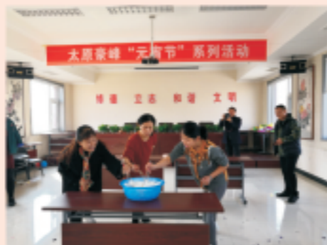
太原豪峰“元宵节”系列活动

2018年3月2日（农历正月十五），太原豪峰污水处理有限公司开展了以“继传统，促发展”为主题的元宵灯谜游艺系列活动。除了有传统的元宵节猜谜语外，还有“爆声隆隆闹元宵”、吃“汤圆”及“团结友爱”等游艺项目，让职工在紧张工作之余，增长了知识，开阔了思路，放松了身心，营造了欢乐、祥和的公司文化氛围。