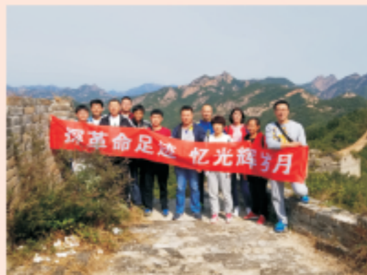
秦皇岛公司探革命足迹忆光辉岁月

2018年10月，国中（秦皇岛）污水处理有限公司组织庆国庆红色之旅活动，来到了素有“吊挂长城”之称的董家口长城，瞻仰革命圣地。活动增强了员工的爱国情怀，大家纷纷表示要继承弘扬革命前辈的优良传统，努力做好本职工作，为构建和谐社会贡献力量，把我们的国家建设得更加美丽。