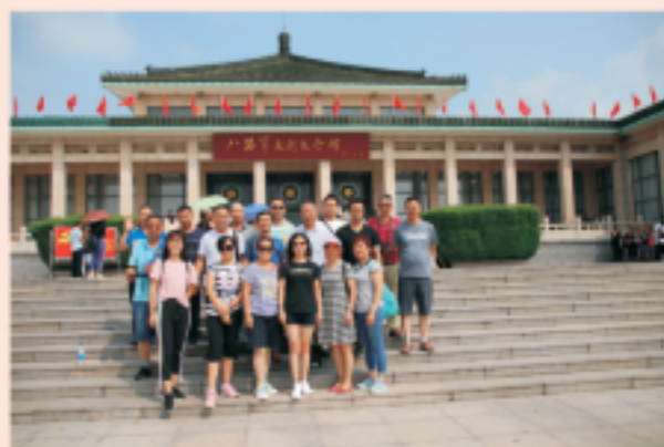
太原豪峰党员八路军太行纪念馆前合影

2018年7月27日，太原豪峰污水处理有限公司党员、入党积极分子、退役军人共计20余人在支部书记的带领下前往武乡八路军太行纪念馆、八路军太行文化园开展“不忘初心，牢记使命”主题教育活动。弘扬革命先辈勇敢顽强、不畏艰难、百折不挠、无私奉献的“太行精神”；不断加强党性修养，牢记宗旨使命，坚定理想信念，继承革命遗志，扎实做好本职工作，为排水事业发展多作贡献。