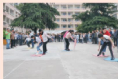
汉中水司庆五一员工文体娱乐活动过河接力赛

2018年4月26日，汉中市国中自来水有限公司举办庆五一员工文体娱乐活动，活动围绕“健康、快乐、敬业、奉献”的主题，通过挖坑、纸牌麻将、齐心协力接力赛、过河接力等赛事，充分激发广大员工的积极性，促进团队交流，加强了员工之间的沟通与信任。