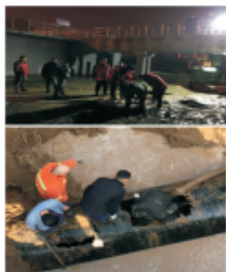
太原豪峰大年初二彻夜抢修

2018年2月17日大年初二，千家万户都沉浸在春节阖家欢聚的气氛中，太原豪峰污水处理有限公司的员工却正经历着一场抢修攻坚战。水厂三号初沉池出水管道出现破损，从地下冒出的水约有一米多高，导致厂区大面积灌水并涌向市区路面。事故发生后30分钟，全厂停水抢修，当晚室外温度零下十几度，还刮着大风，可是抢修队还是咬紧牙关，全力以赴堵水止漏，于次日恢复生产。