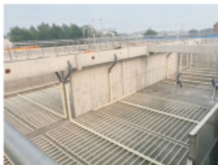
秦皇岛升级改造项目建设现场

2018年9月，秦皇岛市第四污水处理厂升级改造工程竣工验收，该项目位于秦皇岛市海港区龙港路10号，改、扩建工程总建筑面积7014m 2 ，为河北省级重点挂牌督办项目和秦皇岛市重大民生工程、环境改善工程。工程于2016年6月22日开工，2018年6月30日完工，出水水质达到国家规定的一级A排放标准。