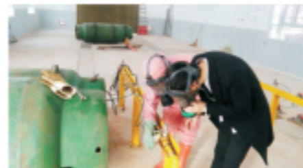
氯气泄漏应急预案演练

2018年4月16日，湘潭国中水务有限公司生产部组织氯气泄漏应急预案演练，整个演练从发现氯气泄漏、启动应急预案、查找泄漏原因、控制泄漏危险点，到警戒、防护、堵漏、清理都做到了有序推进。