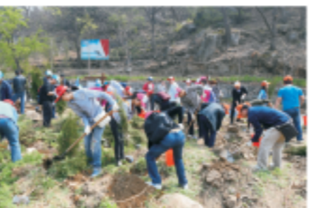
中科国益和水事业部联合组织植树造林公益活动

2018年6月5日，国中（秦皇岛）污水处理有限公司参加了秦皇岛市环保局组织的“美丽中国 我是行动者——绿色秦皇岛 你我携手共建”秦皇岛市六五环境日主题宣传活动，活动现场设立环保咨询台和投诉台，接受群众咨询及投诉。现场累计向群众发放“中央第一环境保护督察组对河北省开展‘回头看’工作明白纸”1500余份，发放环保知识手册及宣传用品7000余份。同时还开展了文艺表演、演讲比赛、环保知识现场问答等丰富多样的主题宣传活动。